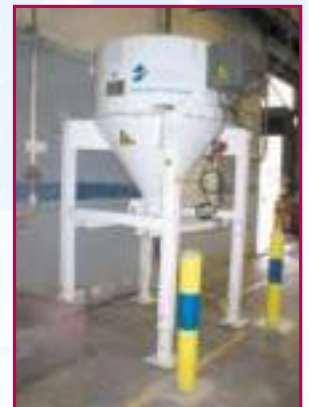
SAM 025 ATEX, Absaugung von PVC Granulate

Die Absaugleistungen sowie die Absaugdistanzen werden als Information genannt. Körnung : 1 kg/dm³ maxi.