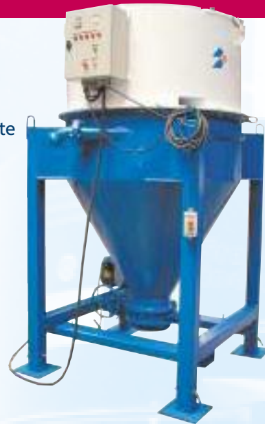
SAM auf regulierbaren teleskopischen Füßen in Höhe