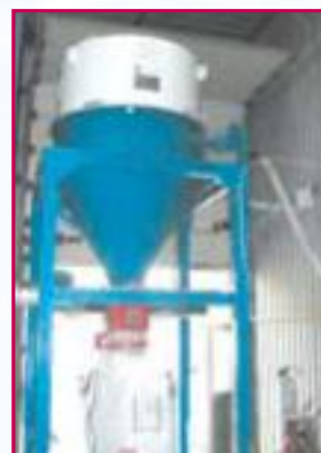
Absaugung in einer Müllverbrennungsanlage